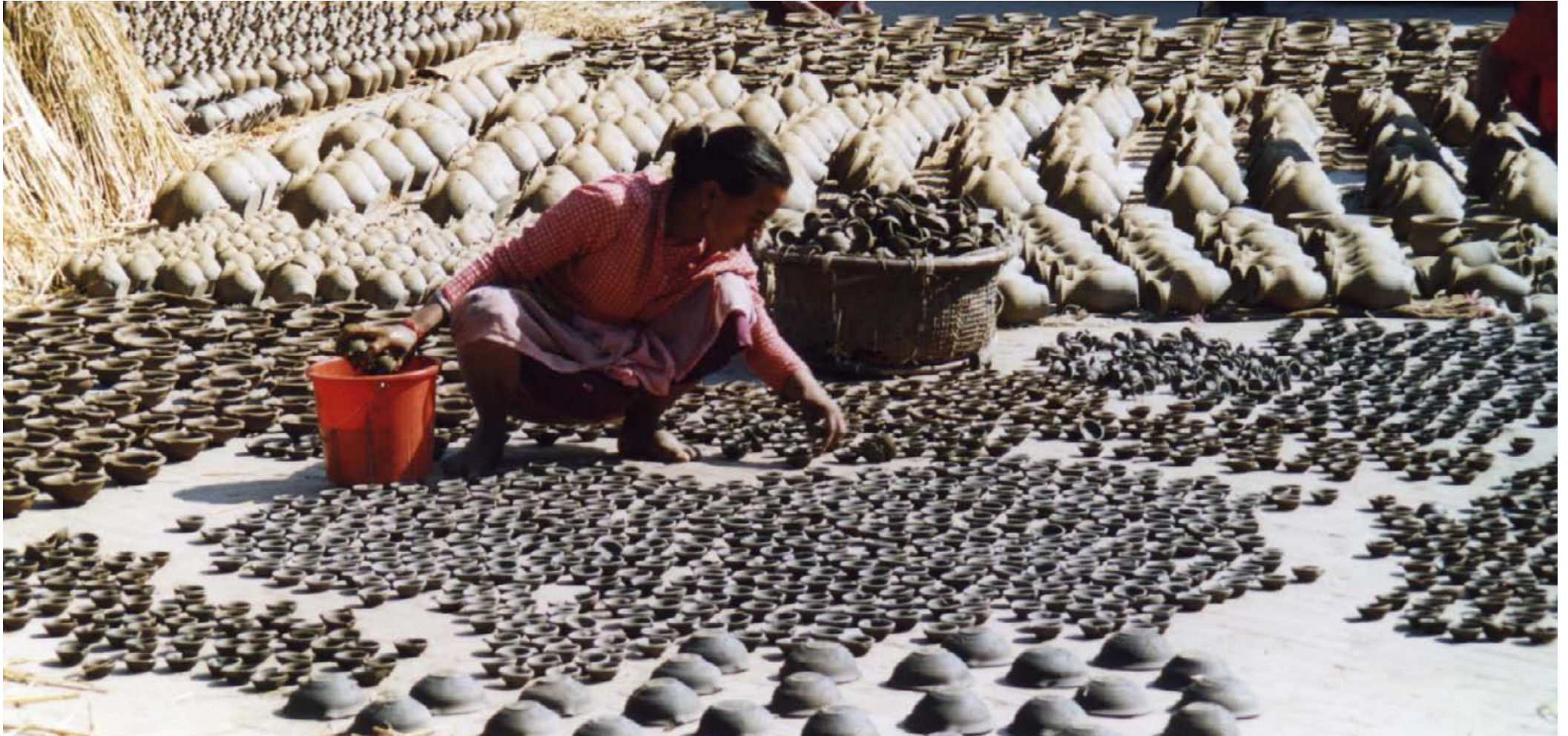
India Sikkim Trek del Kanchenjunga